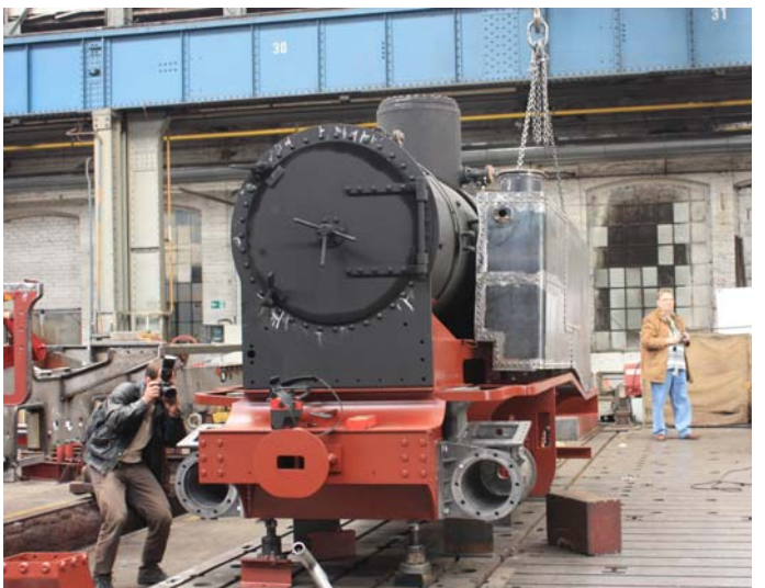
Für die versammelten Vertreter der Medien wurde auch schon mal der linke seitliche Wasserkasten an der Lok aufgesetzt.