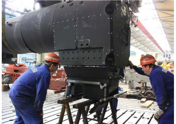
Genaue Positionierung und Anbau des Aschkastens an den Stehkessel.