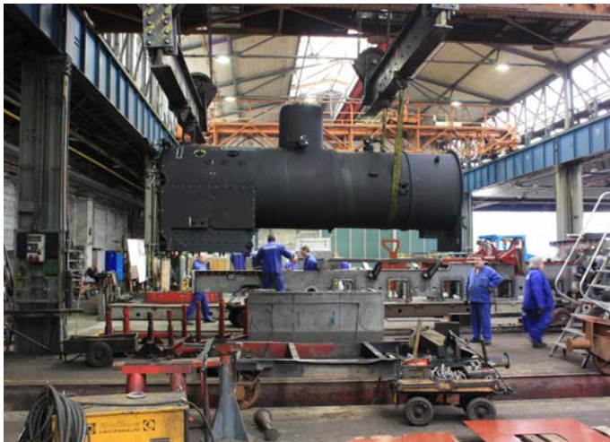
Transport des eingekleideten Kessels zum Montageplatz der Lok.