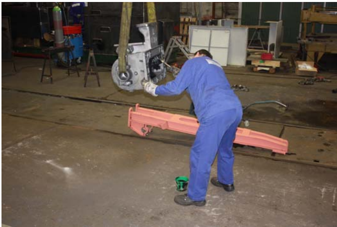
Vorbereitung des linken Dampfzylinders vor dem Anbau an den Rahmen.