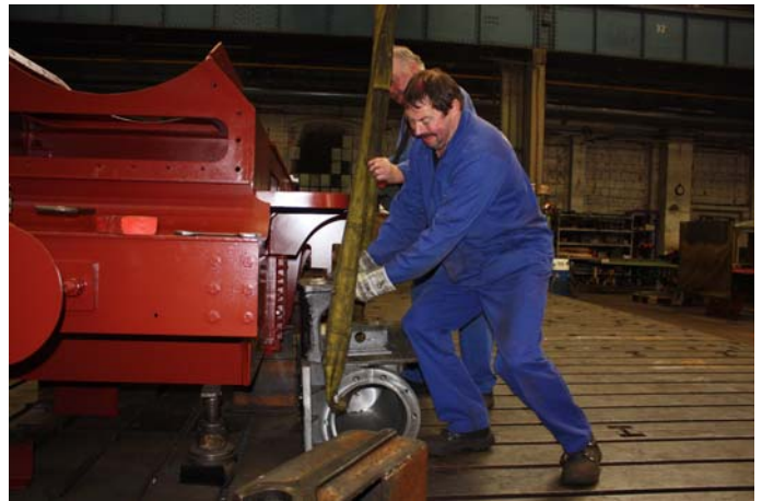
Montage des linken Dampfzylinders an den Lokomotivrahmen.