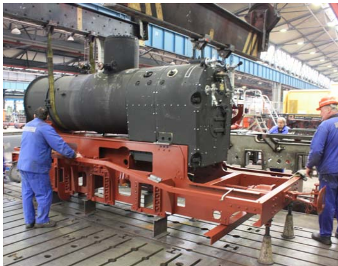
Aufsetzen des Kessels auf den Rahmen und Befestigung an den vorgesehenen Aufnahmen. Jetzt beginnt die Endmontage.